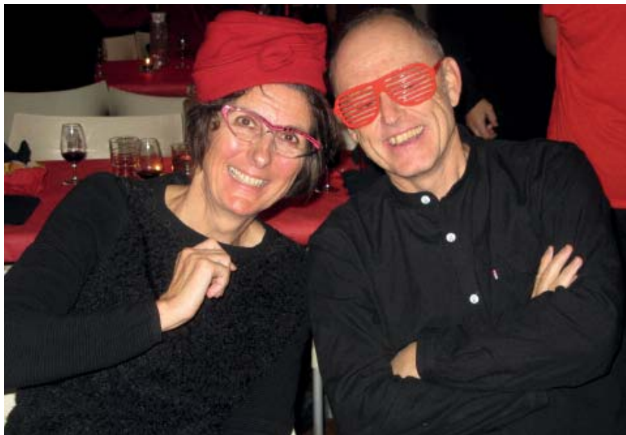
EN ROUGE ET NOIR