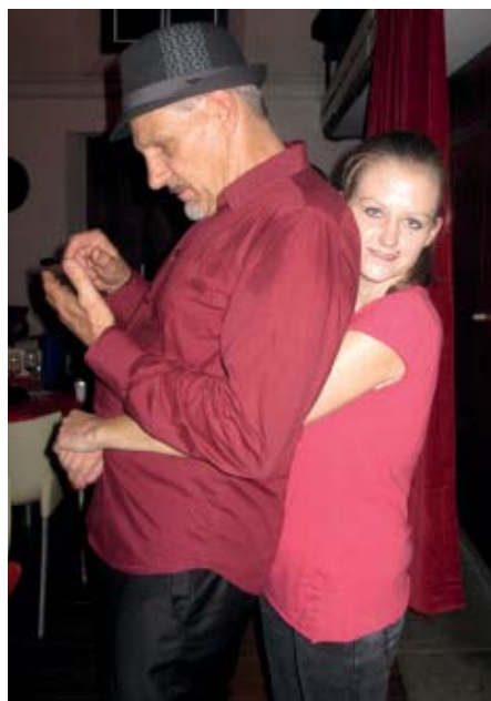
D'UNE TABLE À L'AUTRE