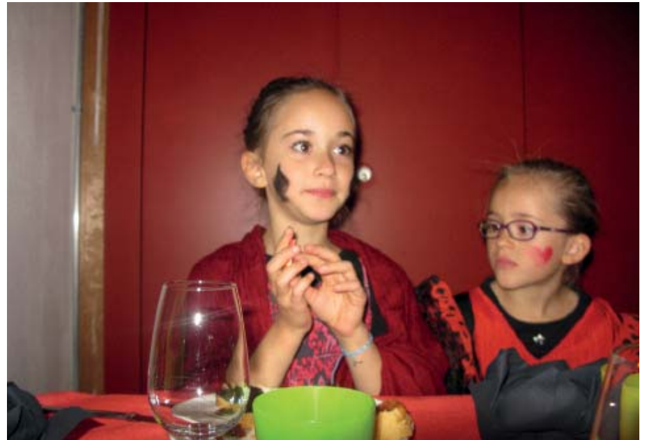
DES JEUNES AUX ANCIENS...