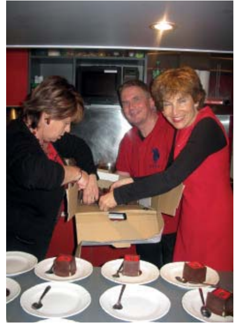
EN ROUGE ET NOIR