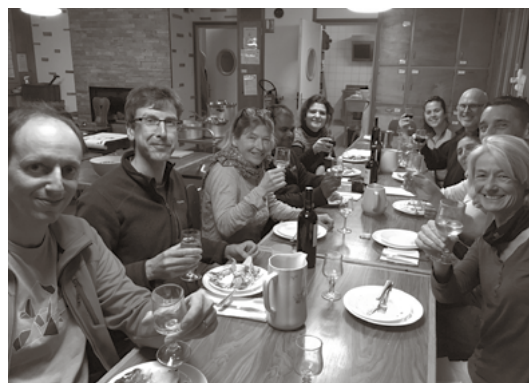
La table des adultes

30 bis, rue des Grottes - 1201 Genève Tél. 022 733 88 27 - Fax 022 733 87 30