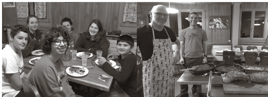
La table des ados