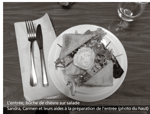
L'entrée, bûche de chèvre sur salade Sandra, Carmen et leurs aides à la préparation de l'entrée (photo du haut)

Comme chaque année, le chalet reçoit les familles des Amis lato sensu; cette année ce fut du 18 au 22 février. Magnifique semaine, il est inutile de le dire, même si la neige, tombée en abondance, se transformait en neige de printemps au fur et à mesure que les jours s'égrenaient et que les heures coulaient. La faute en revenait aux chaleurs excessivement élevées pour la saison.