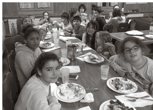
La table des enfants