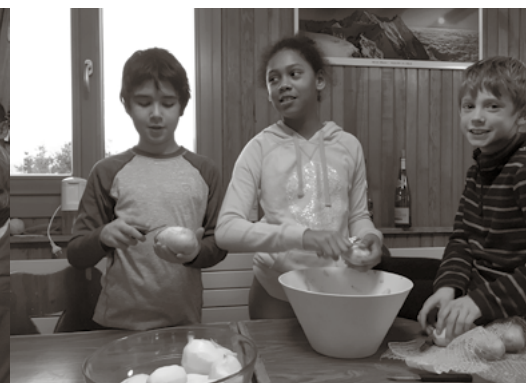
Les enfants à l'épluchure des patates