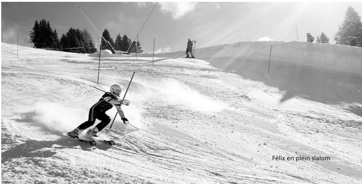
Félix en plein slalom