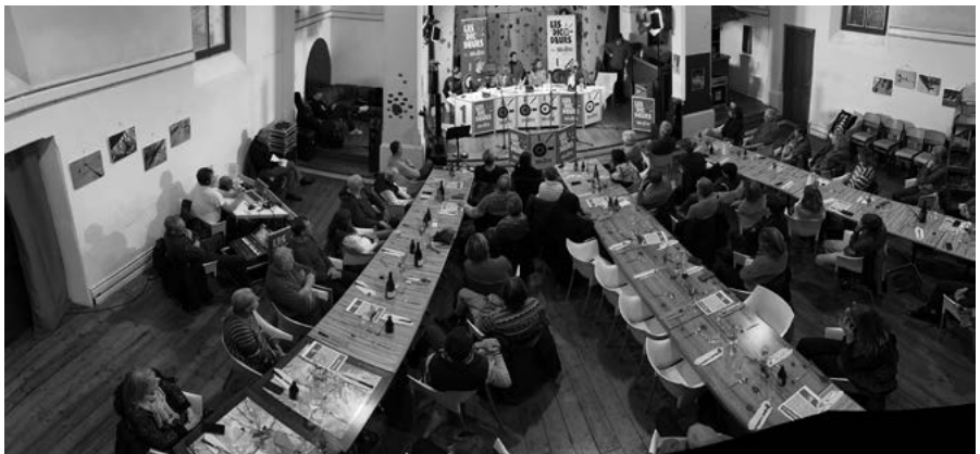
A cette occasion, des tables à géométrie variable...