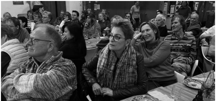
Un auditoire captivé...