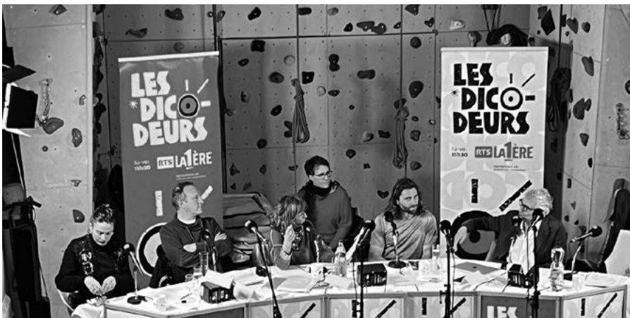
Les animateurs devant le mur de grimpe, au milieu d'eux, la script girl