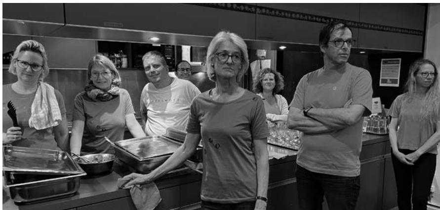
Une partie de l'équipe organisatrice de la soirée